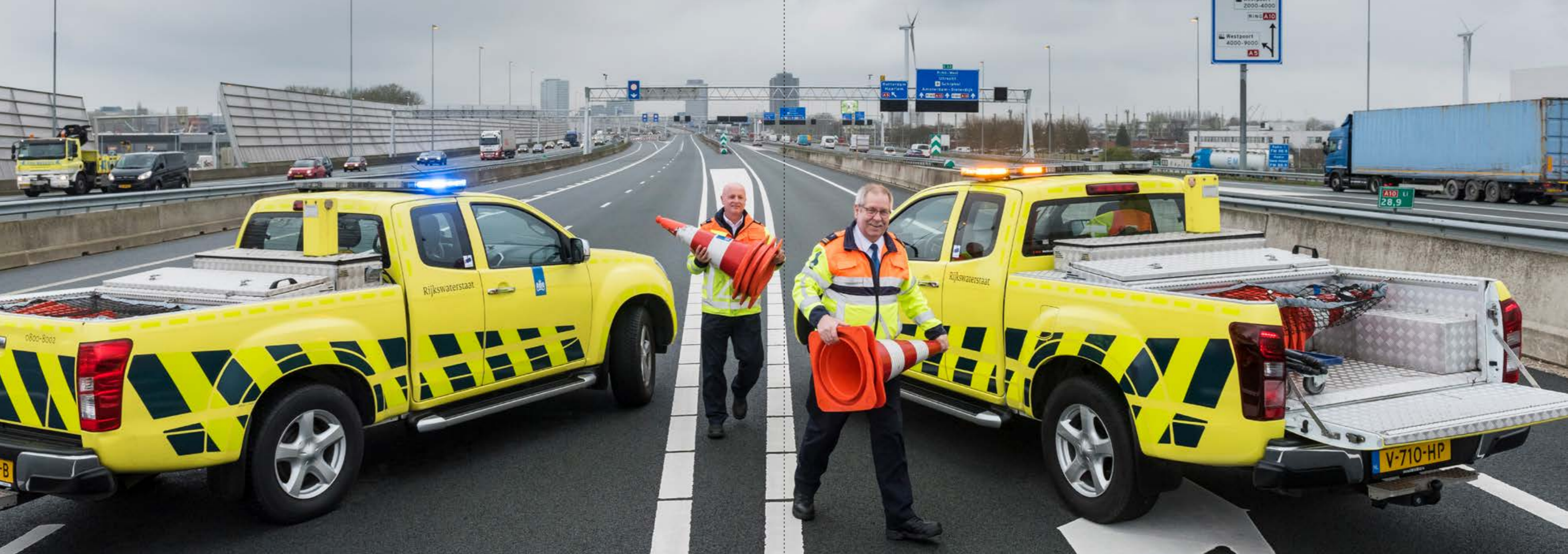
Weginspecteurs ruimen een wegafzetting op